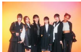
Little Glee Monster Precious Live 完全版