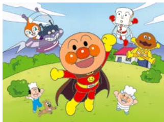
「それいけ!アンパンマン」スペシャル ©やなせたかし/フレーベル館・TMS・NTV ©やなせたかし/アンパンマン製作委員会 毎週日曜9時から放送