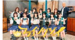
「フライングジョイ」 <#2> 12/2(月)23:30~24:00 <#3> 12/16(月)23:30~24:00ほか