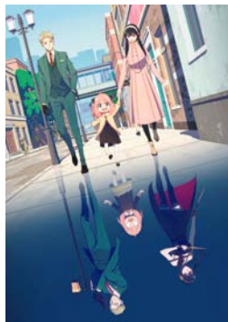
「SPY x FAMILY(スパイファミリー)」 ©遠藤達哉/集英社・ SPY x FAMILY製作委員会